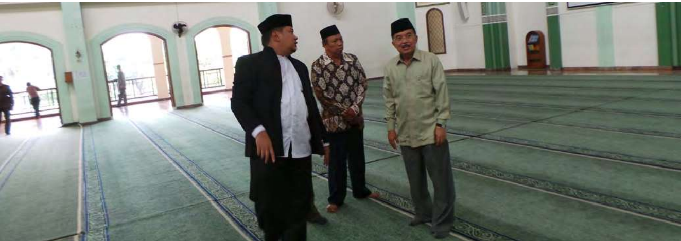
H.M Jusuf Kalla sedang meninjau sebuah masjid

lah berkata, “Aku mendengar Sufyan Ats-Tsauri rahimahullah berkata, ‘Kebaikan di dunia adalah rizqi yang baik dan ilmu, sedangkan kebaikan di akhirat adalah Surga.’ (Jaami’ Bayaanil ‘Ilmi wa Fadhlihi (1/229-230, no.252 dan 253, dan 254) dan al ‘Ilmu Fadhlulu wa Syarafuhu.