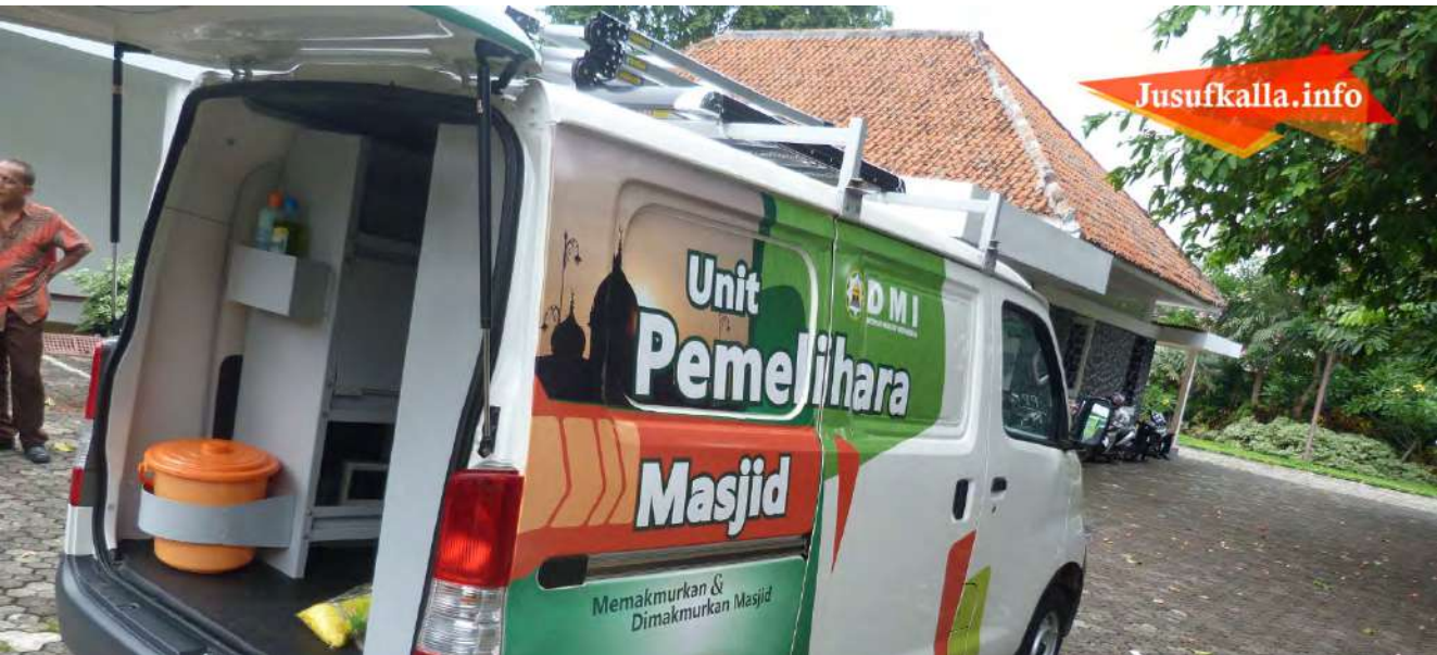
Sebuah mobil unit pemeliharaan masjid

dan Antar Lembaga PP DMI, Sofyan Djalil, pihaknya tengah melakukan program penataan akustik di lebih 9000 masjid yang tersebar di Jakarta, Banten, Jawa Barat, DIY, Bali, dan Jawa Timur. Ia menambahkan, untuk pelaksanaan, DMI menggandeng tim teknisi dari perusahaan elektronik terkemuka, yakni PT TOA dan Panasonic.