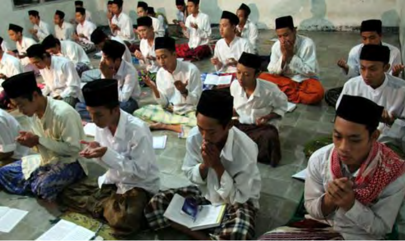
berdoa sebelum mengaji