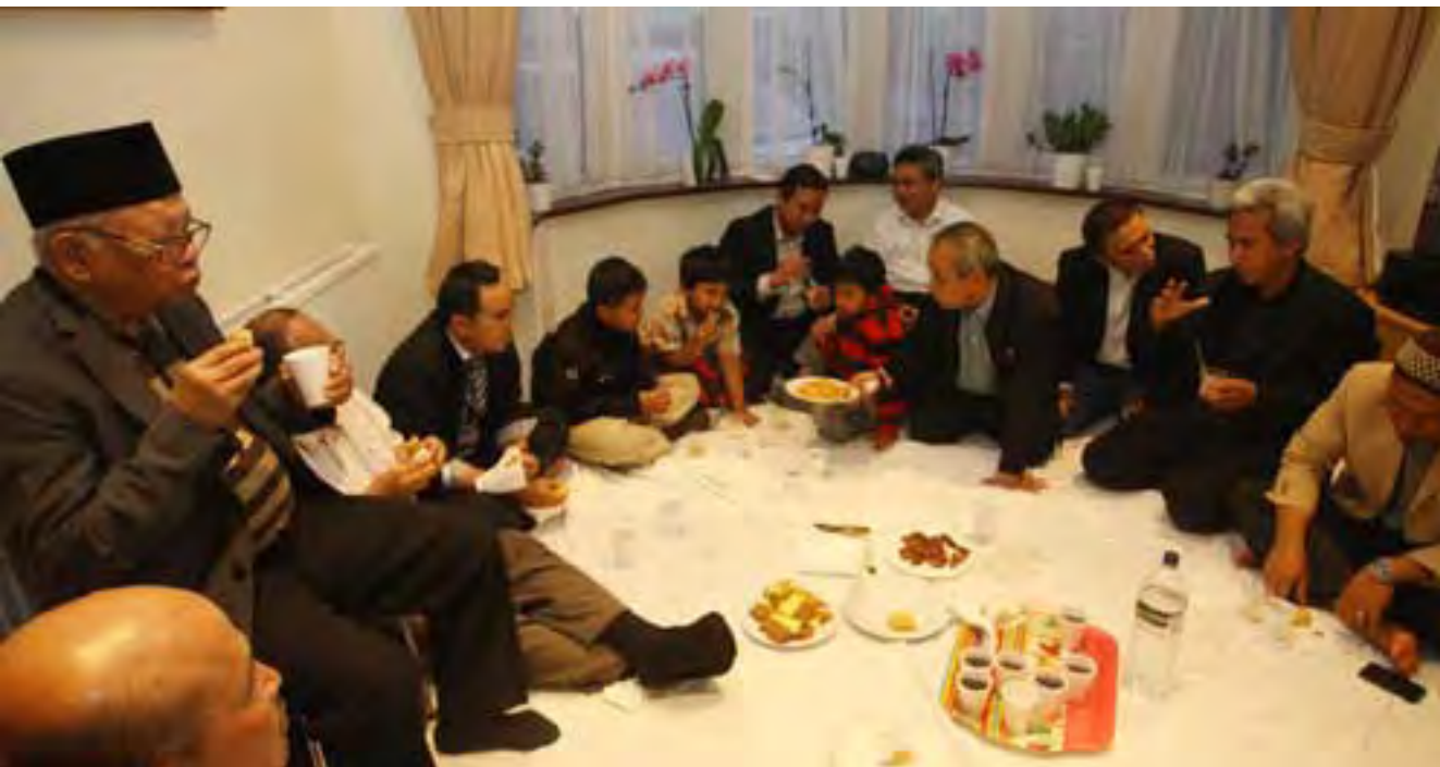
Suasana buka puasa masyarakat muslim Indonesia di London