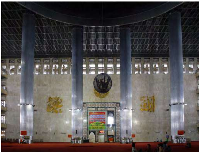
Tiang masjid yang sangat kokoh