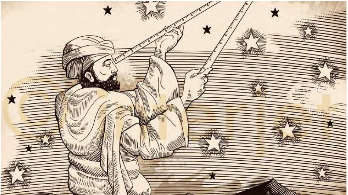
Astronom Arab sedang melakukan penelitian.

ton 500 tahun kemudian. Al-Biruni juga mengajukan hipotesa tentang rotasi bumi di sekeliling sumbunya. Konsep ini lalu dimatangkan dan diformulasikan oleh Galileo Galilei 600 tahun setelah wafatnya Al-Biruni.