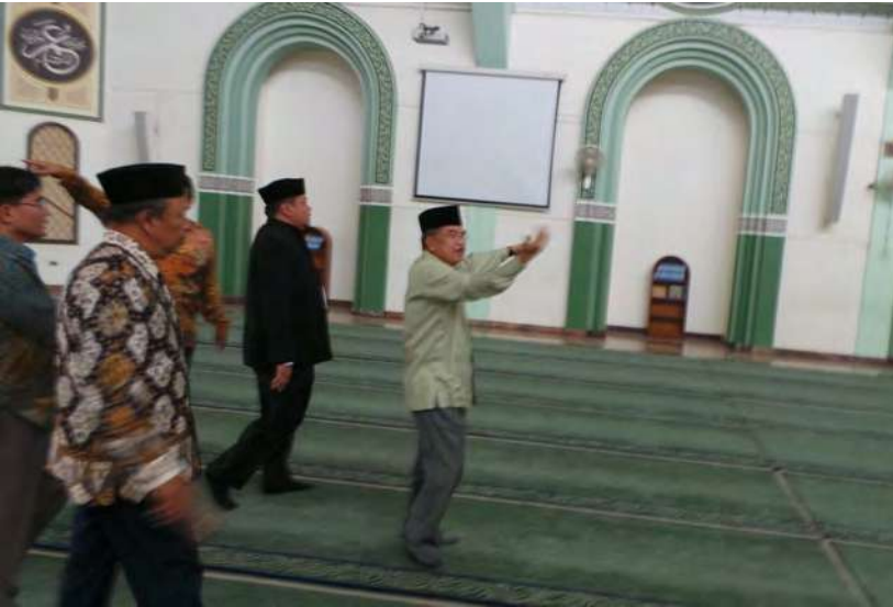
Salah satu kegiatannya sebagai ketua Dewan Masjid Indonesia.

tamakan pendekatan urgensi relative yang ditentukan berdasar analisis atas tata urutan pemenuhan kebutuhan dasar ( basic need ) sampai kebutuhan sejahtera ( welfare need ) dan spiritual need. Untuk itu, pembuatan program kegiatan yang sejalan sangat menentukan (determinan).