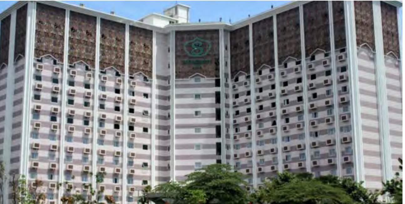
Pariwisata syariah menumbuhkan munculnya hotel syariah