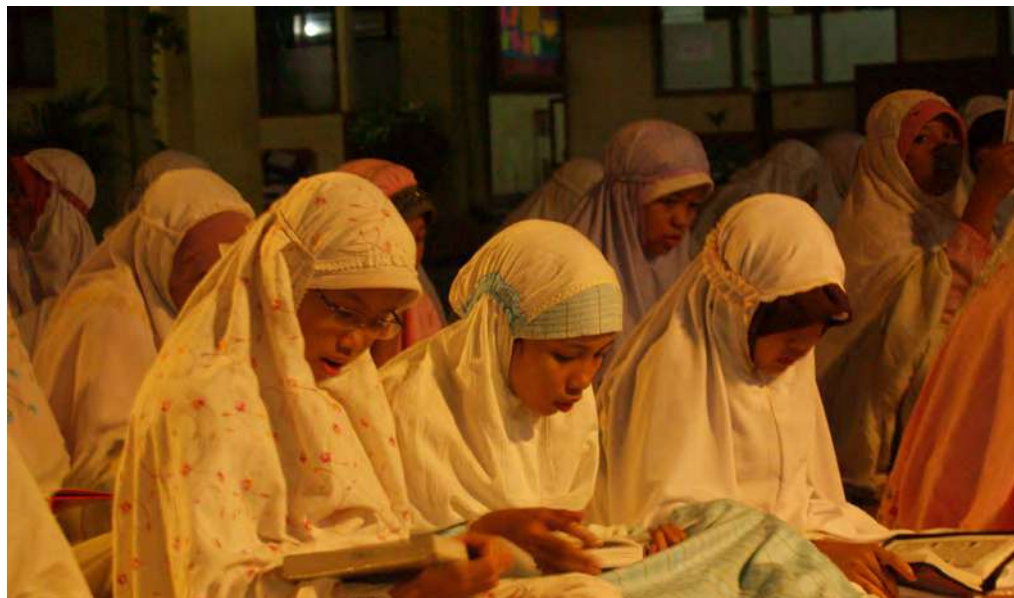
Memperbanyak membaca Al Quran diajarkan saat bulan Ramadhan