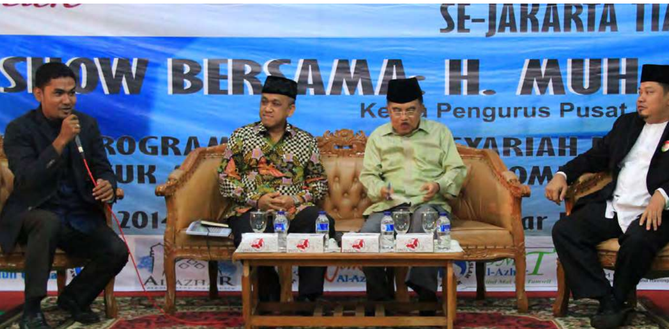
HM Jusuf Kalla dalam sebuah acara diskusi.