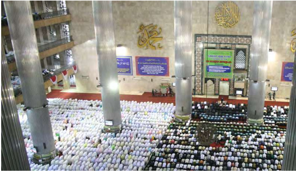
Kaum muslimin sedang melakukan shalat berjamaah di Masjid Istiqlal