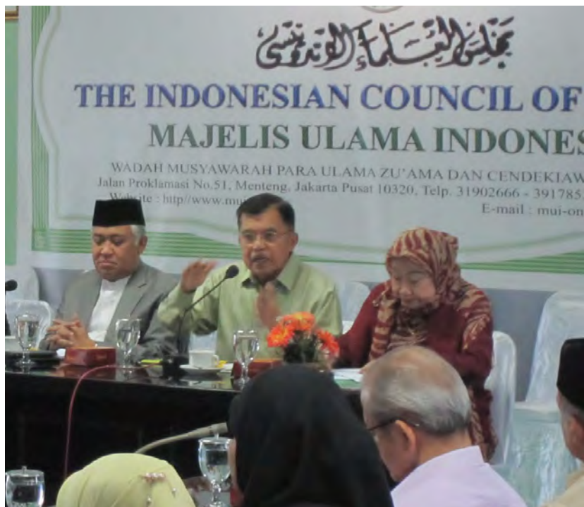
Ketua DMI Jusuf Kalla bersama pengurus Majelis Ulama Indonesia.

Saat ini, menurut Ketua Bidang Kominfo, Kerjasama Luar Negeri dan Antar Lembaga PP DMI, Sofyan Djalil, pihaknya tengah melakukan program pe-nataan akustik di lebih 9000 masjid yang tersebar di Jakarta, Banten, Jawa Barat, DIY, Bali, dan Jawa Timur. Ia menambahkan, untuk pelaksanaan, DMI menggandeng tim teknisi dari perusahaan elektronik terkemuka, yakni PT TOA dan Panasonic.