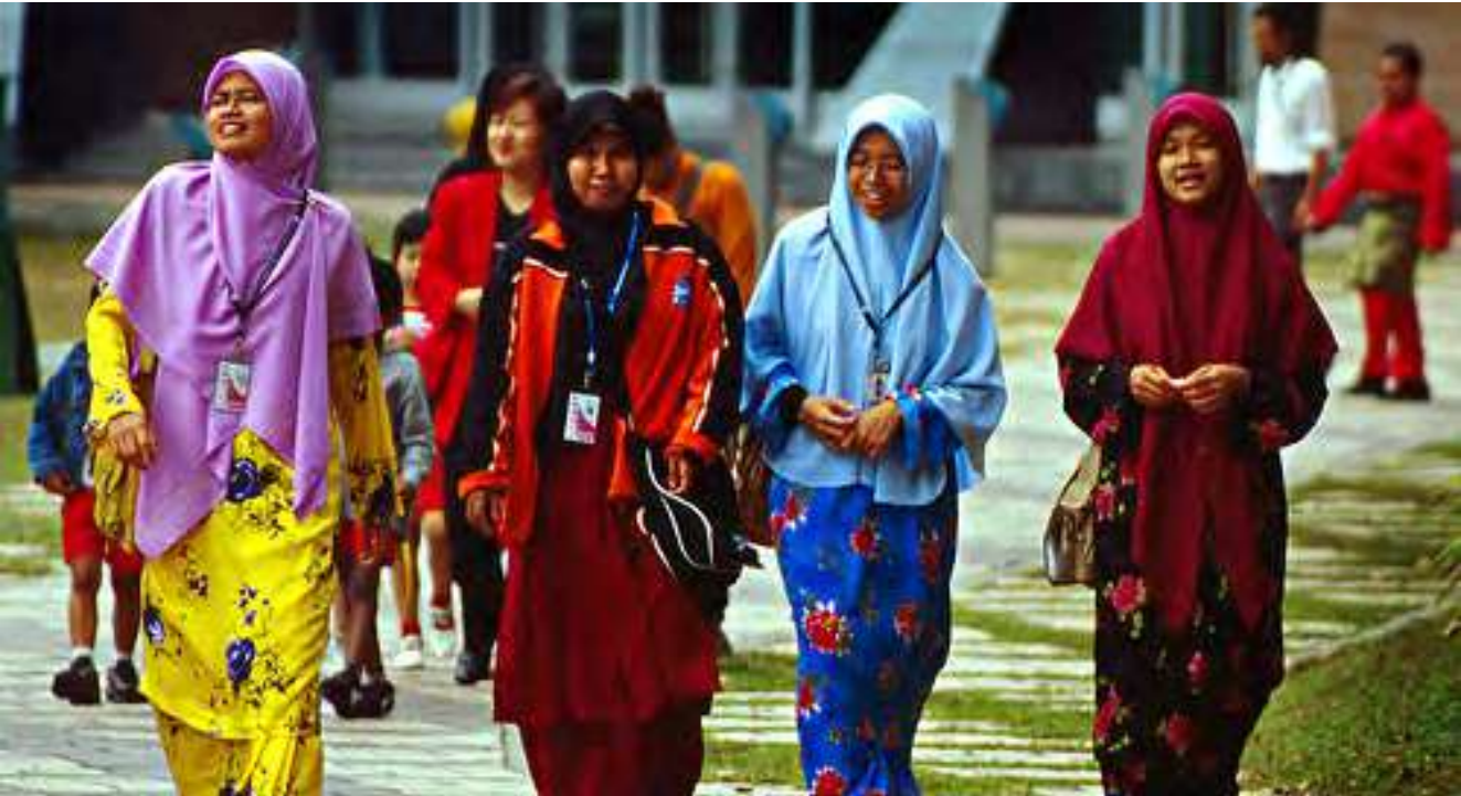
Muslimah Malaysia sedang melakukan aktiviras.

Menurut hasil studi yang dilakukan di 232 negara di dunia, jumlah umat Islam di seluruh dunia saat ini sekitar 1,57 miliar orang, dari semua usia. Jumlah itu mewakili 23 persen total penduduk dunia yang jumlahnya mencapai 6,8 miliar jiwa sampai tahun 2009