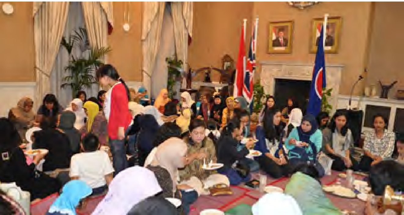
Pengajian masyarakat Indonesia di London

Sebelumnya, IIC London menyampaikan proposal IIC-London kepada Wapres Jusuf Kalla dan mengharapkannya dapat menyampaikan kepada pihak-pihak di Indonesia untuk membantu dalam mewujudkan cita-cita IIC-London untuk memiliki suatu Islamic Centre tersebut. .