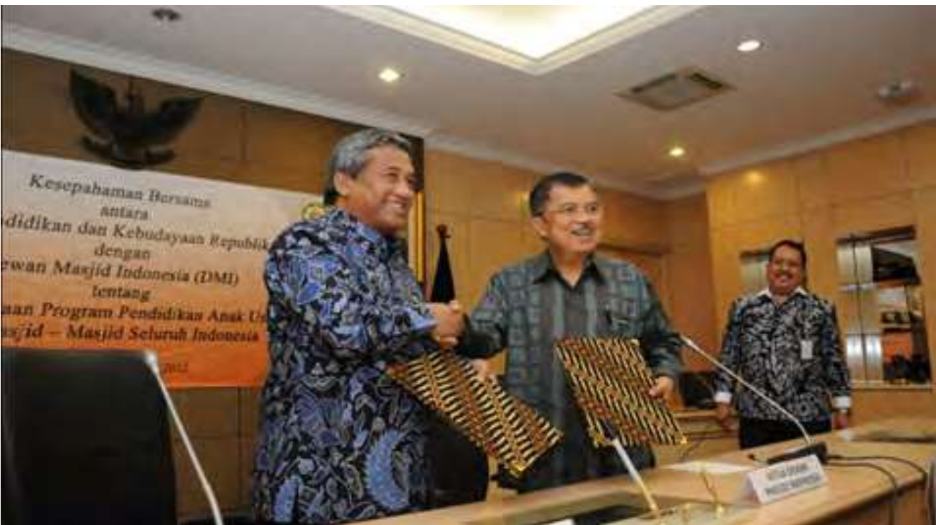
Mendikbud dan Ketum DMI usai melakukan penandatanganan kerjasama

Lebih dari 60 persen masjid di Indonesia sound systemnya jelek, sehingga jika dai/ustad berceramah/khutbah, tidak jelas suaranya, mengaung. Akibatnya, pesan dakwah tidak sampai dengan baik, jamaah juga merasa tidak nyaman. Dai ceramah, jamaah ngantuk