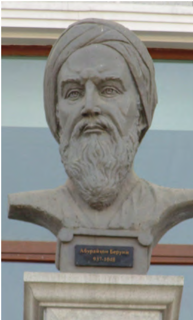
Al Biruni, jasanya sangat dikenang hingga saat ini.

Kepiawaian dan kecerdasan Al-Biruni merangsang dirinya mendalami sekitar ilmu astronomi. Ia misalnya memberikan perhatian yang besar terhadap kemungkinan gerak bumi mengitari matahari. Sayangnya, bukunya yang membicarakan soal ini hilang. Namun ia berpendapat, seperti pernah ia sampaikan