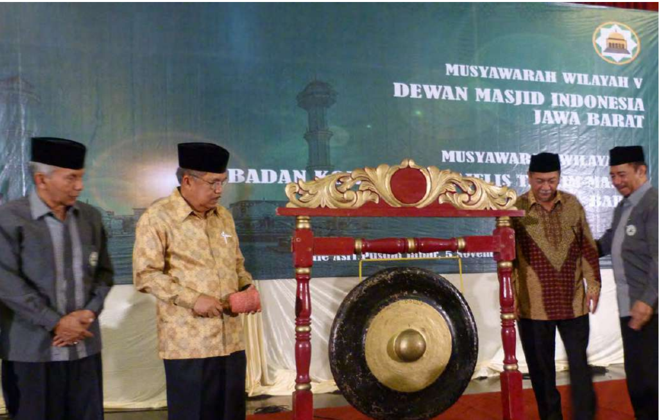
Pembukaan Musywil DMI Jawa Barat