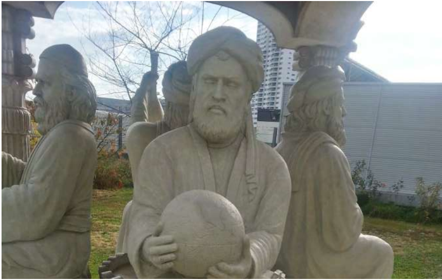
Patung Al Biruni dengan ilmuwan lain di Vienna Austria.

dalam suratnya kepada Ibnu Sina, bahwa gerak eliptis lebih mungkin daripada gerak melingkar pada planet. Al-Biruni konsisten mempertahankan pendapatnya tersebut, dan ternyata di kemudian hari terbukti kebenarannya menurut ilmu astronomi modern.