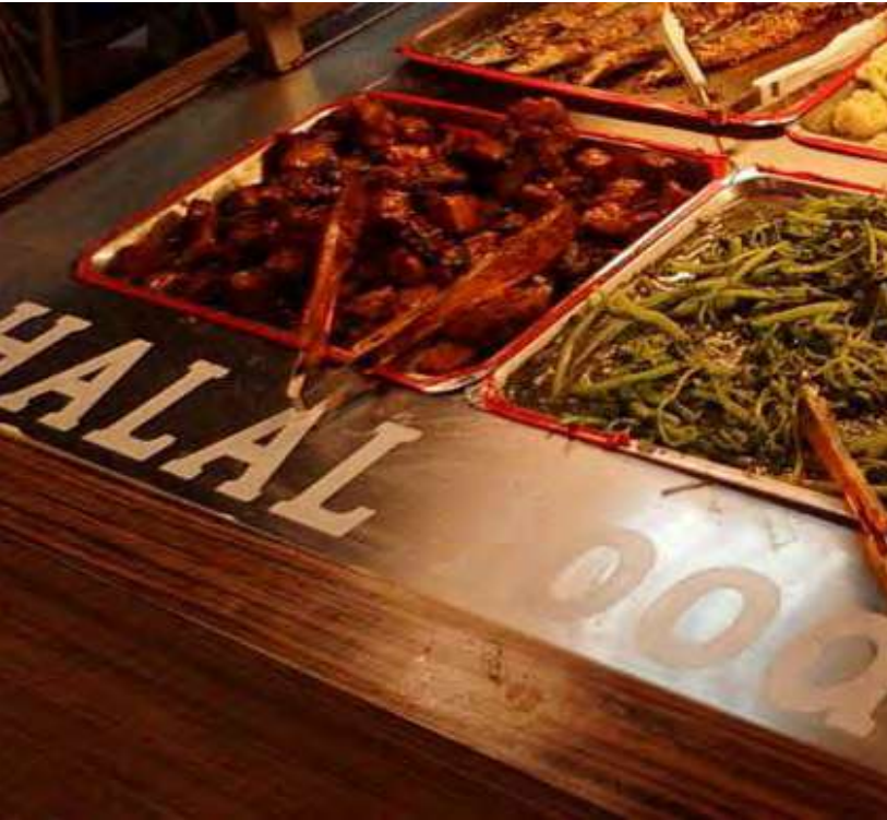
Halal food menjadi keharusan dalam wisata syariah.

Oleh karena itu, mereka akan cenderung memilih pusat perbelanjaannya yang memberikan mereka fasilitas untuk melaksanakan shalat. Sejumlah pusat perbelanjaan di Bangkok misalnya telah melengkapi diri dengan ruangan yang bisa digunakan Muslim untuk melaksanakan shalat. Hal ini mereka lakukan karena semakin tingginya jumlah Muslim yang singgah ke pusat perbelanjaan setiap tahunnya. Thailand juga menyediakan mushala di bandara utamanya.