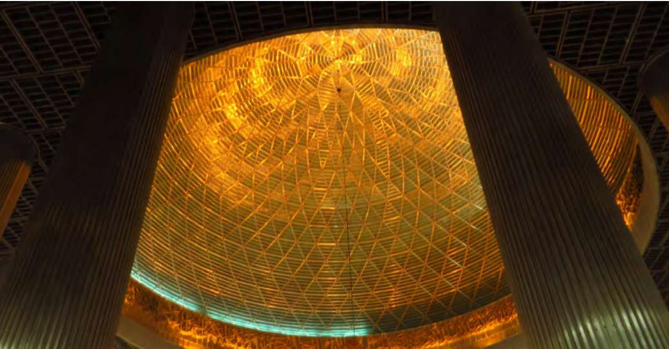
Kubah masjid yang sangat indah

Di seluruh dunia, boleh jadi satu-satunya masjid nasional yang berdampingan dan berdekatan dengan gereja hanya Masjid Istiqlal dan Gereja Katedral di Jakarta,