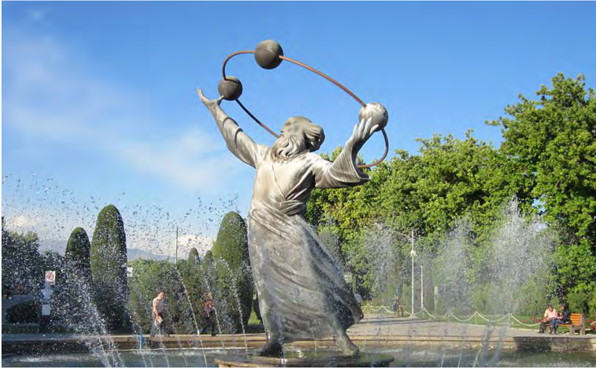
Patung Al Biruni