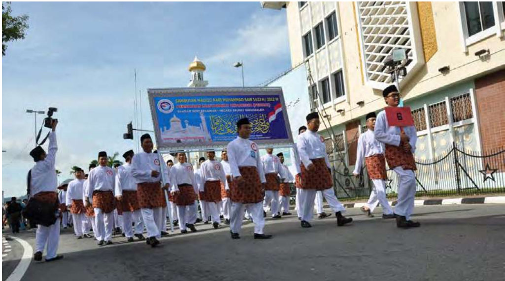
Salah satu kegiatan masyarakat Islam di Brunei Darussalam

ini jumlahnya cenderung besar. Negara India misalnya, jumlah Muslim di India adalah ketiga terbesar di dunia. Populasi Muslim di China lebih besar dibandingkan di Suriah. Begitu pula di Rusia, populasi Muslim di negara ini lebih besar dibandingkan di Yordania dan Libya.