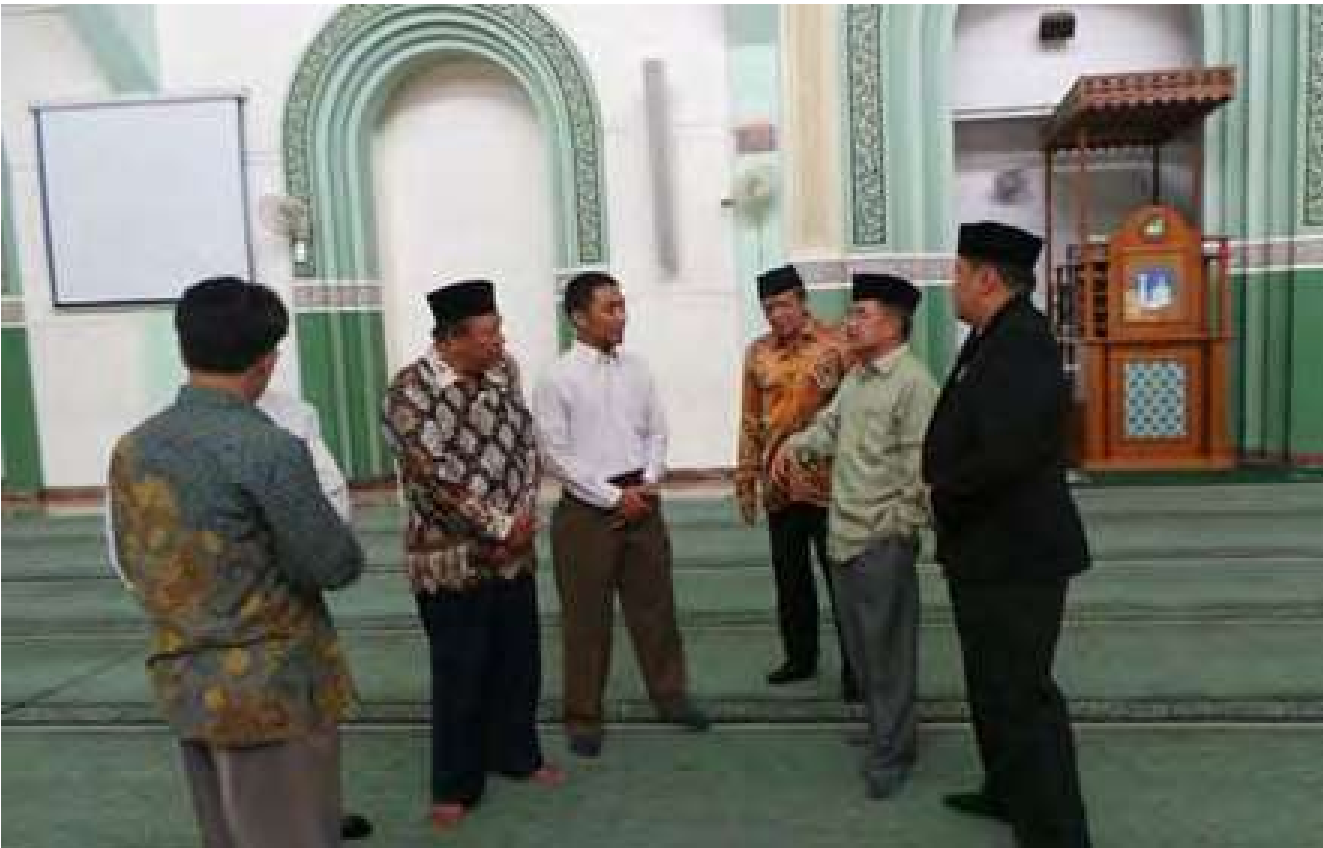
JK saat melakukan sidak soundsystem di masjid Al-Azhar, Cakung, Jaktim